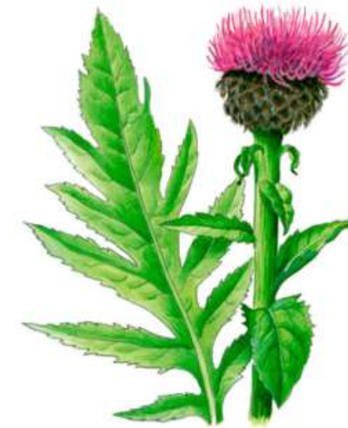
Левзея сафлоровидная ( Rhaponticum carthamoides )