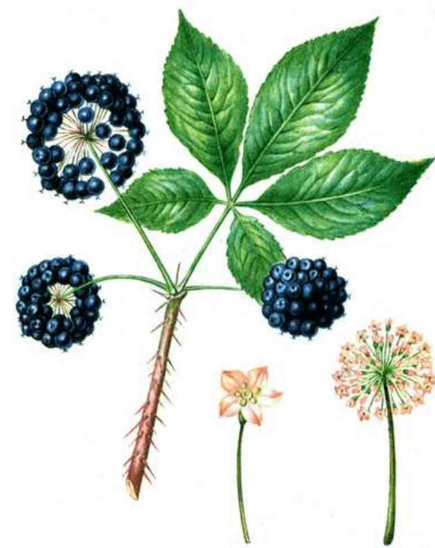
Элеутерококк ( Eleutherococcus senticosus )

В России, в Сибири, произрастает более 500 видов растений, которые используются нами для производства различных экстрактов