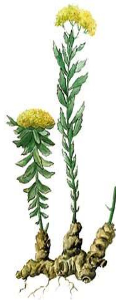
Родиола розовая ( Rhodiola rosea )