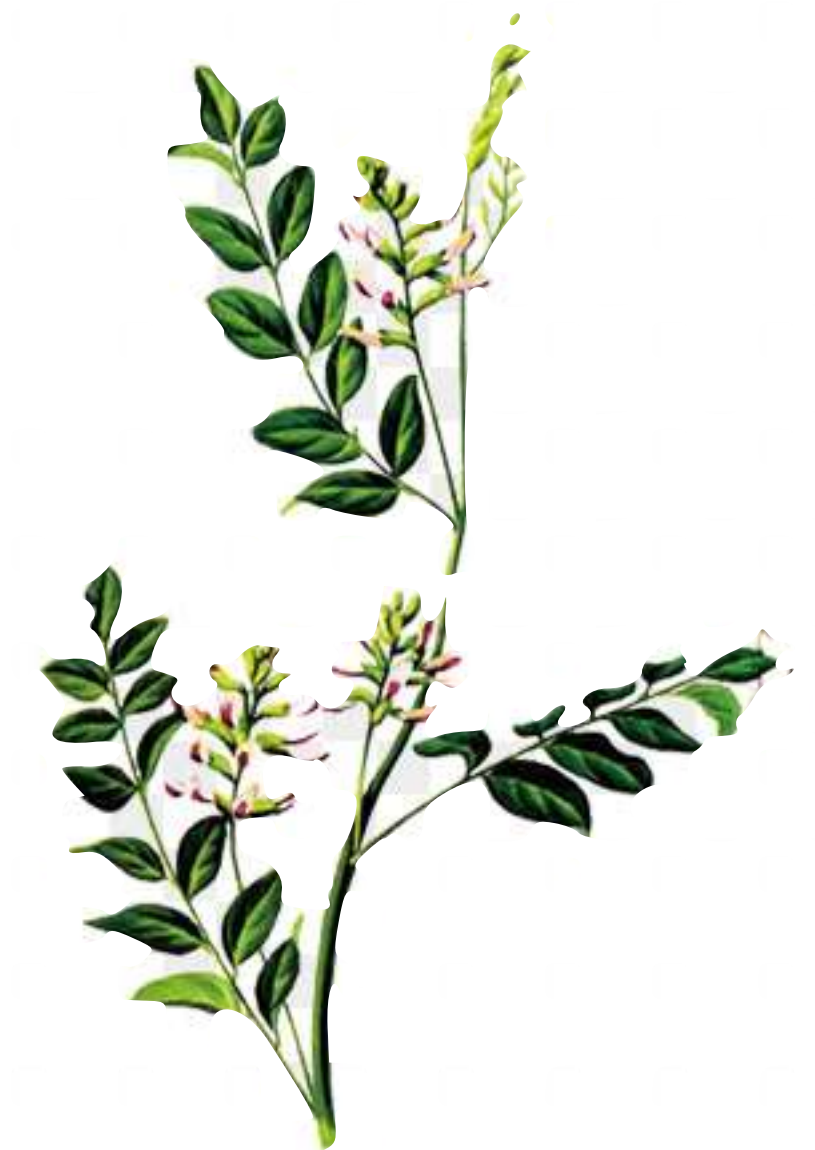
Солодка уральская ( Glycyrrhiza uralensis )