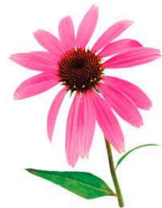
Эхинацея ( Echinacea purpurea )